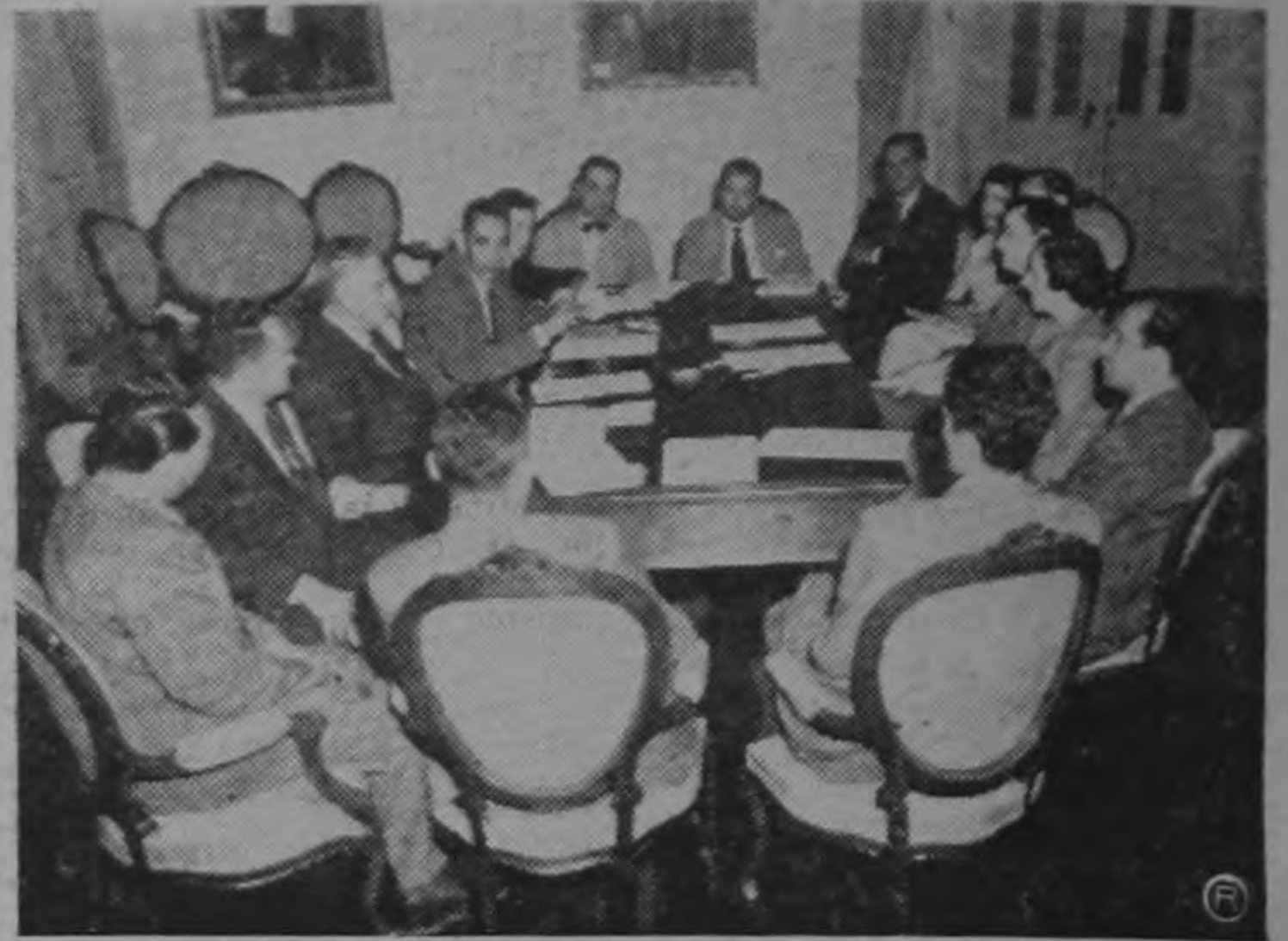
En los salones de la Casa Amarilla se reunieron anoche los representantes de los diversos organismos internacionales de ayuda técnica que actúan en Costa Rica para confrontar puntos de vista, exponer experiencias y coordinar planes de trabajo.

Se acordó en esa reunión publicar un boletín informativo que recoja las resoluciones de esta conferencia que se prolongarán por varias semanas.