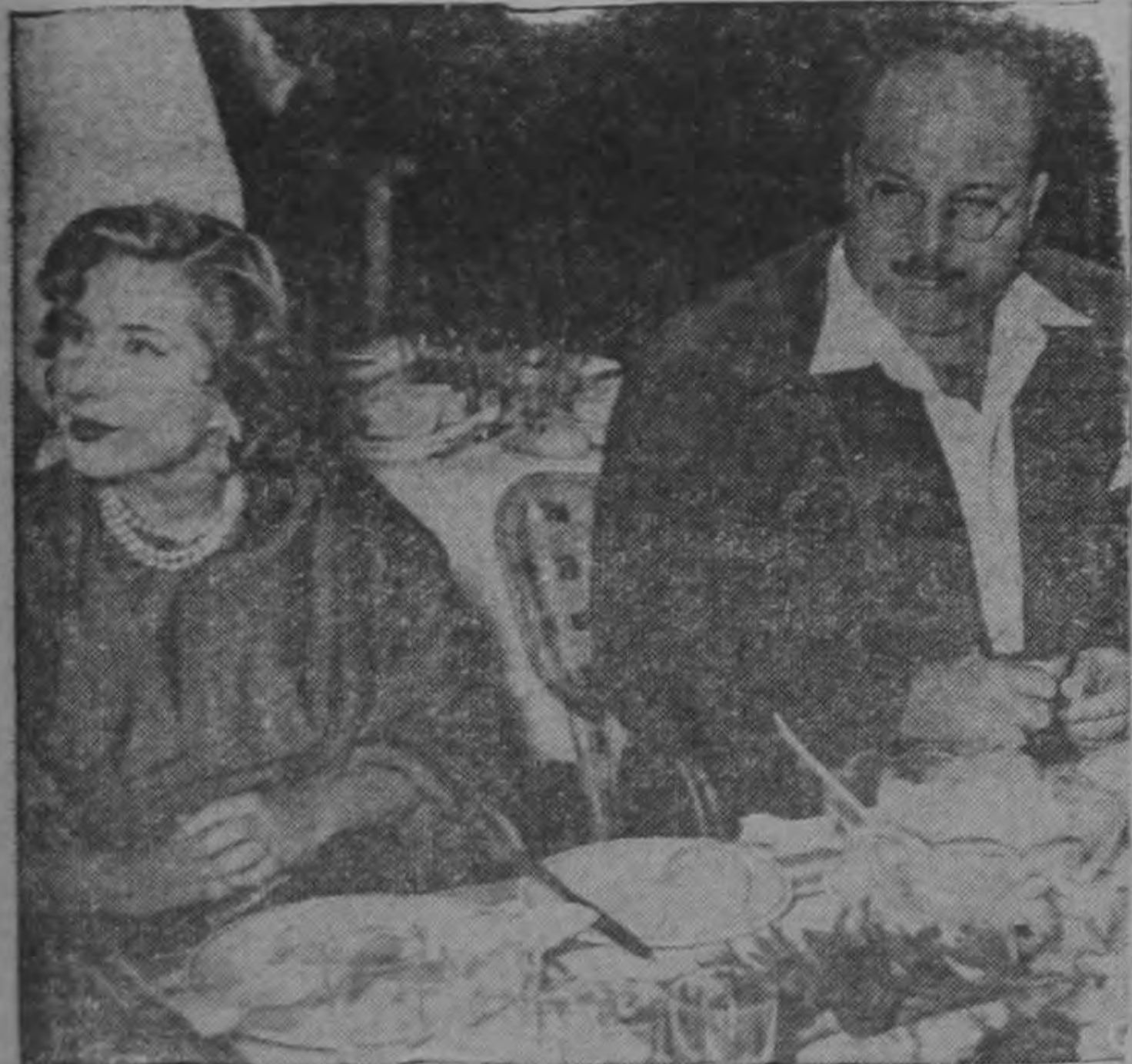
Entre los clientes regulares del elegante restaurant de Gracie Field, "Song of the Sea", en Capri, figuran el ex-Rey Farouk, del Egipto, y su esposa, Narriman. El ex-Rey, que se dice que es fabulosamente rico aunque él insiste que es "un hombre pobre", figuró recientemente en el noticiario por una discusión que tuvo respecto a la cuenta que le presentaron en el hotel de Capri.